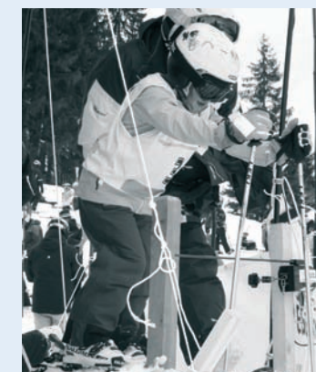
Und dann geht's los...

Die Rangverkündigung mit der obligaten Medaillenverteilung fand gleich anschliessend im Zielgelände statt. Dank der grosszügigen Unterstützung der Hauptsponsoren Baloise Bank SoBa, dem Restaurant Blüemli matt Egerkingen, Raiffeisen und vieler weiterer Sponsoren und Gönner konnten unter allen Gestarteten des Riesenslaloms 50 attraktive Naturalpreise verlost werden. Der Anlass gehört zur Raiffeisen-SSM-Throphy Alpin unter dem Patronat von Raiffeisen.