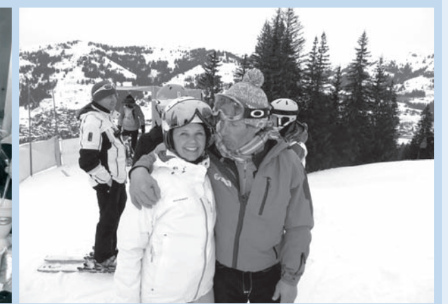
Wir haben immer was zu lachen