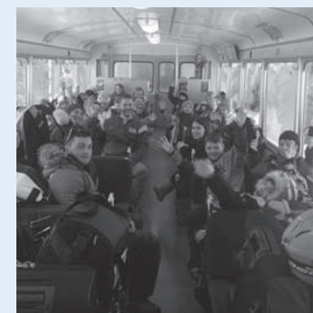
On the way!

als Abschluss dieser Lagerwoche. Nebst lustigen Spielen und zaghaften Tanzversuchen galt es auch noch die Sieger des Skirennens zu verkünden, was von allen sehnsüchtig erwartet wurde. Die glücklichen Sieger und die Zweit- und Drittplatzierten durften einen Pokal entgegennehmen, der zwar nicht so gross ausfiel wie im Weltcup, der berechnete Stolz der Gewinner war aber nicht minder goss.