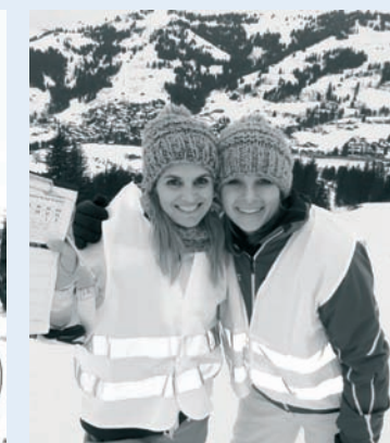
Die Torrichter machen einen super Job