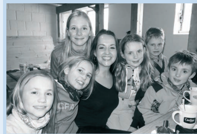
Unsere Egerkinger Skicracks

Das aktuelle Programm immer unter www.skiclubegerkingen.ch