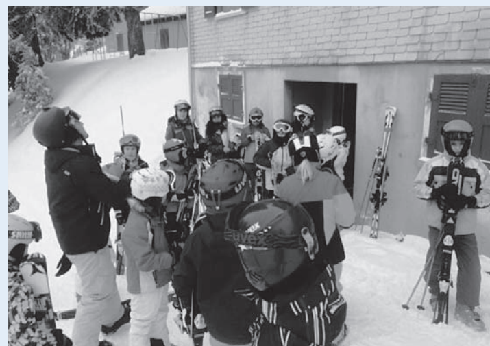
Ab uf d Piste!

Das Abendprogramm wurde vom jungen und äusserst motivierten Leiter team gestaltet und wusste die jüngsten wie auch die älteren Teilnehmer zu begeistern. Tolle Preise und Gutscheine gab es am beliebten Lottoabend zu gewinnen und auch wenn das Glück nicht allen wohlgesinnt sein konnte, mit leeren Händen musste niemand ins Bett. Für den Filmabend wurden in der Lagerküche Massen von Popcorn produziert um ein originalgetreues Ambiente zu schaffen. Die selbst gebaute Schneebar und ein gemütliches Lagerfeuer luden zur Après-Ski-Party mit Punsch, heisser Schokolade und gebratenen Marshmallows. Den Höhepunkt bildete wie in jedem Lager der Bunte Abend