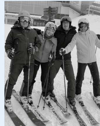
Unterwegs auf den Pisten von Ischgl/Samnaun