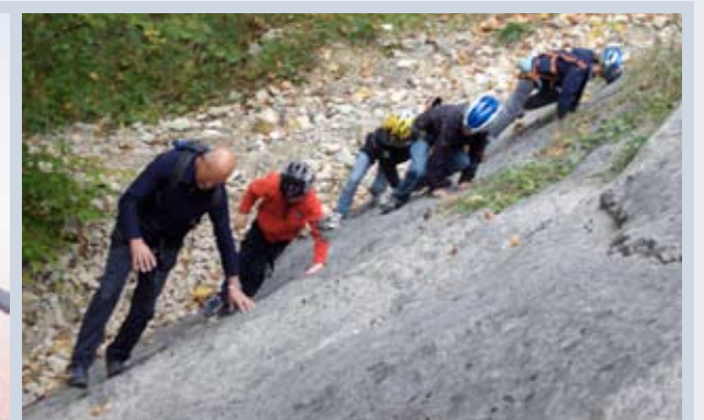
Klettern mit dem Ferienpass